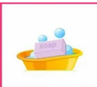
МОЕМ РУКИ С МЫЛОМ